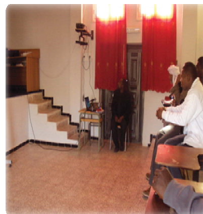
Formation des agriculteurs