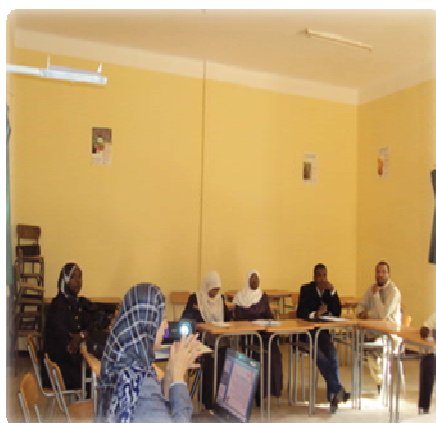
Formation des cadres

La formation a porté sur « la gestion de la fertilité des sols » et « la maîtrises des techniques d'irrigation ».