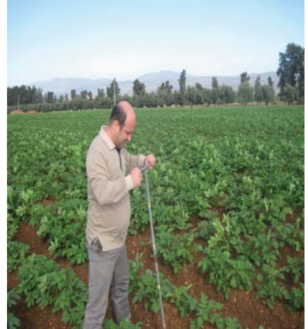
Photo : Précédent cultural avant la mise en culture des céréales (Ferme Bouhmidi, Ain Defla)

Dans le cadre de la mise en œuvre du programme de la Sécurisation de la production céréalière par l'irrigation, les cadres du Laboratoire INSID à Relizane ont effectués des sorties sur terrain au cours du mois de Novembre à l'effet de procéder à la prospection et l'échantillonnage des sols au niveau de six fermes pilotes dans la région ouest. Ainsi, des questionnaires relatifs au mode d'irrigation et de fertilisation ont été renseignés, les échantillons de sol prélevés sont en cours d'analyses au niveau du laboratoire à fin de suivre le bilan hydrique et de fertilité du sol de ces parcelles.