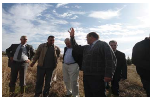
Ferme Pilote Si Abdelkrim (W. de Tiaret)

Des visites sur terrain ont été effectuées en collaboration avec les responsables de la SGP/SGDA, au niveau des fermes pilotes pour la mise en place des unités de démonstration et au niveau des deux exploitations agricoles privées pour la proposition d'un protocole expérimental.