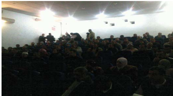
Regroupement du 03/12/2012 - la Maison de la culture de la wilaya de Médéa

Directeur de publication : Mr. HABILA Mohamed