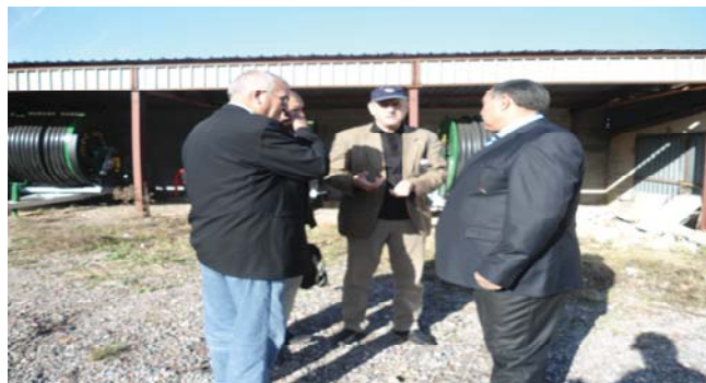
Participation a une journée ( Wilaya de Guelma) le 18/11/2012